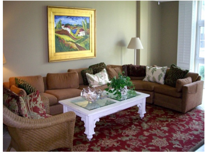
Riesiger und heller Wohnbereich