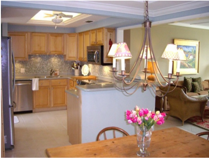
Blick in die riesige Küche