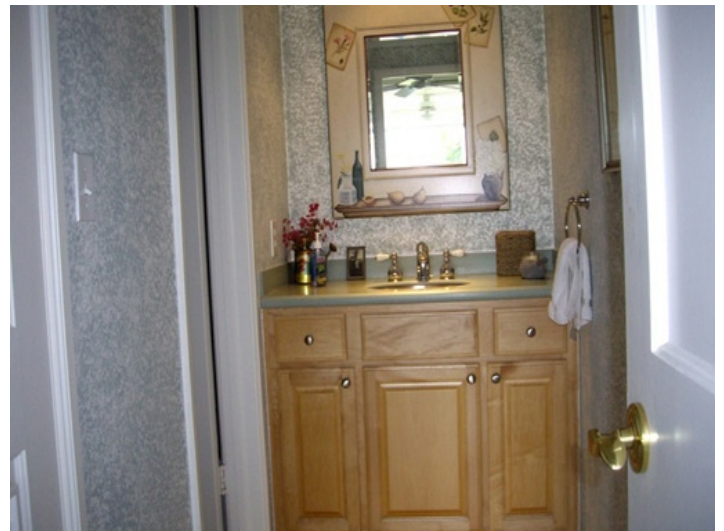
Eingang zum Master-Bad