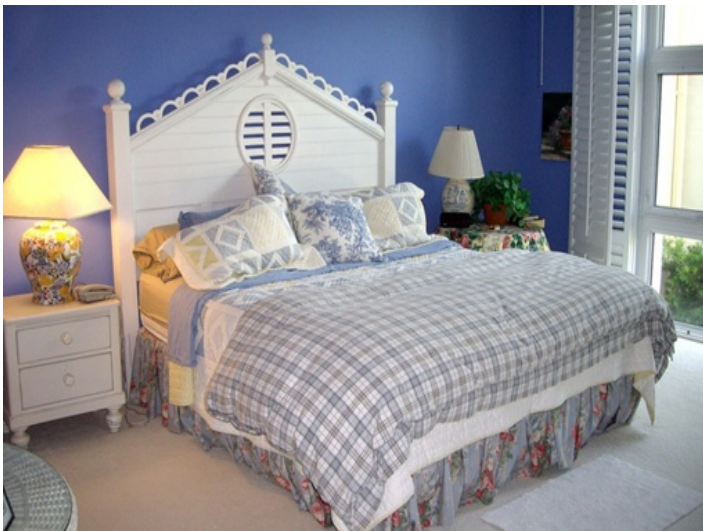
Master-Schlafzimmer mit Kingsize-Bett