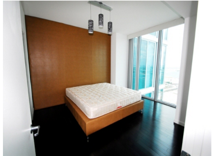
Schlafzimmer mit Blick auf die Bay