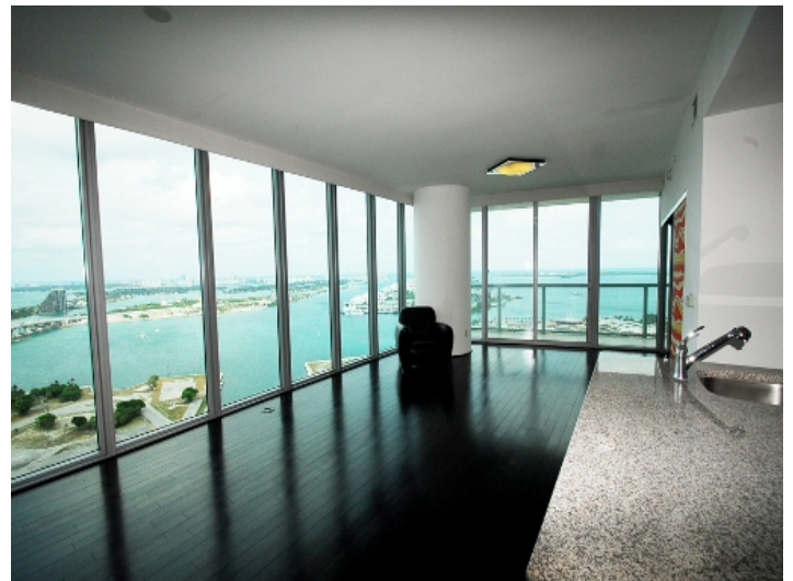
Meterlange Fensterfront im Wohnzimmer

Alle Angaben nach bestem Wissen. Irrtum und Zwischenverkauf vorbehalten. Dieses Exposé ist eine Vorinformation, als Rechtsgrundlage gilt allein der notariell abgeschlossene Kaufvertrag.