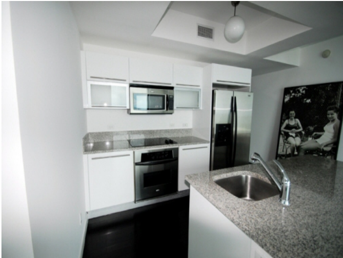
Neuwertige Ausstattung und Kücheninsel