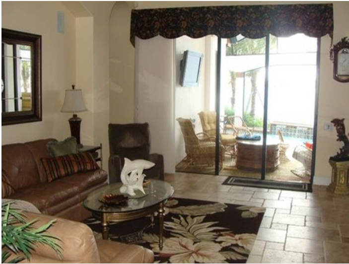
Wunderschönes Wohnzimmer mit Terrasse und Mediencenter in Fort Myers