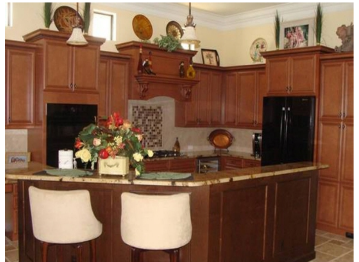
Familiäre Küche mit Frühstücksbar in Fort Myers