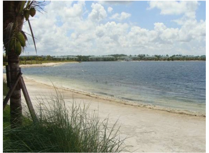
Blick auf das idyllische umliegende Terrain in Fort Myers