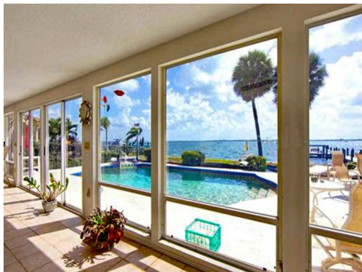
Panoramafenster mit Blick auf den Pool und die Bucht