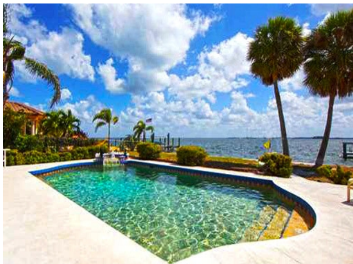
Schöner Pool mit Blick auf die Bucht